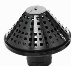
Грязевой фильтр x 1